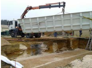
4. Mise en place du camion pour effectuer le déchargement