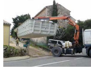
3. Acheminement vers le site de pose