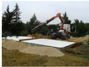
5. Déchargement en fond de fouilles (si les conditions requises sont bien respectées)

NB : Le collage de la bonde de fond est à la charge du client ou de son représentant chargé de la réception du bassin. Il en est de même en cas de demande exceptionnelle de pré-raccordement en usine, les collages doivent être vérifiés à la réception du bassin. A ce titre, les défauts de raccordement ne peuvent pas engager notre responsabilité.