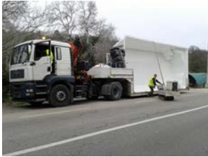
1. Arrivée sur le chantier - Analyse des conditions pour effectuer la livraison