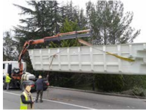
2. Dételage (prévoir au minimum une hauteur de 7M)